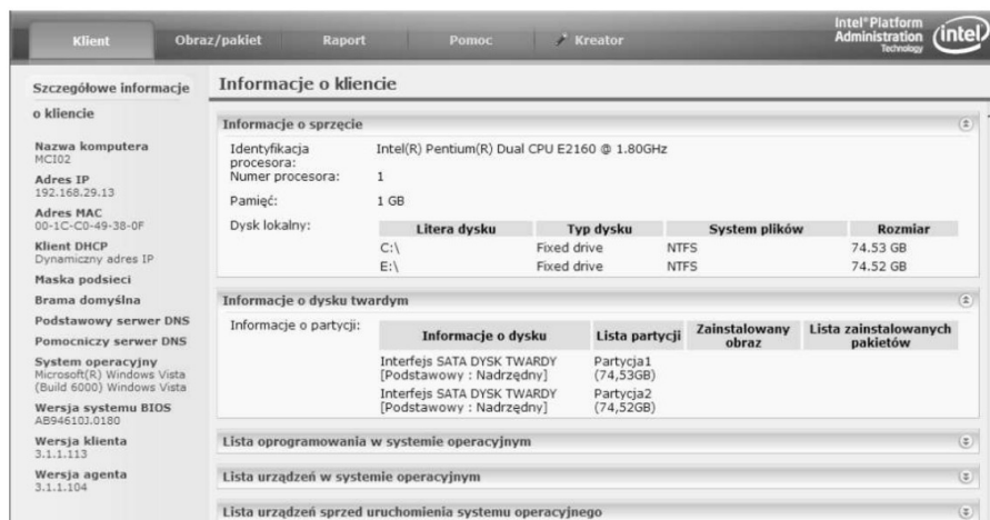
Rysunek 8: Informacje o zarządzanym komputerze.