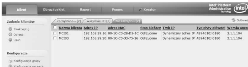
Rysunek 9: Zarządzanie nowymi klientami.