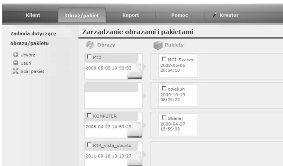
Rysunek 10: Tworzenie obrazów dysków.

Zarządzanie sieciami jest sporym ułatwieniem pracy administratora sieci. Można się było przekonać o tym choćby na przykładzie prostego systemu zarządzania siecią IPAT. Wiele czynności można wykonać kilkoma kliknięciami.