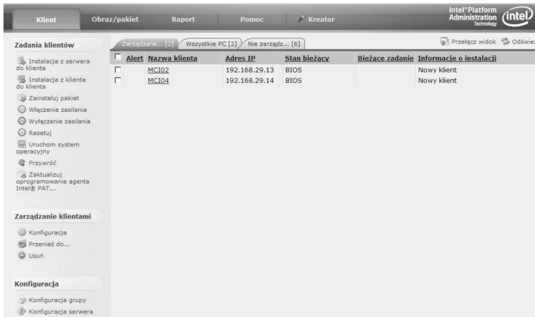
Rysunek 7: Pulpit zarządzania komputerami w oprogramowaniu IPAT.